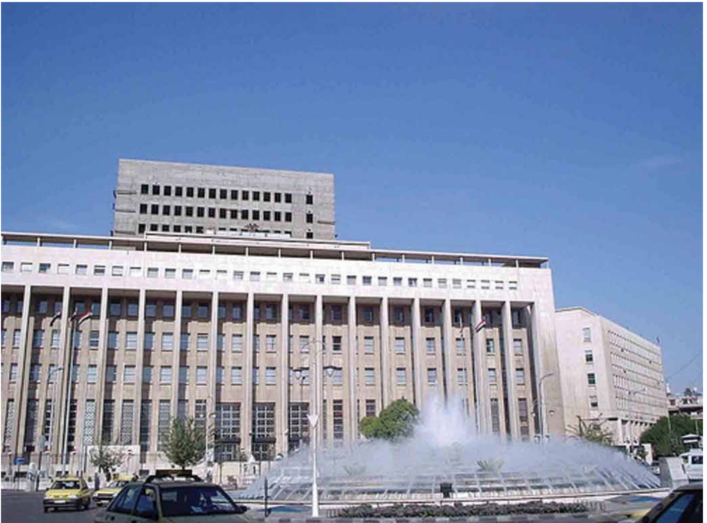
• Central Bank of Syria, Damascus

zed banks will continue to play their key role especially in the areas of industrial financing and services. Moreover, specialized Syrian industrial and agricultural banks are involved in financing long-term loans.