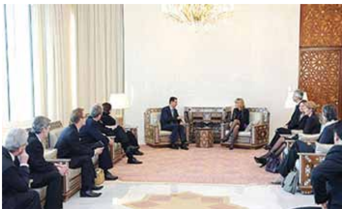
• Udenrigspolitisk Nævn i Mellemøsten