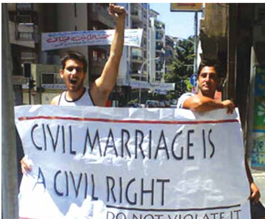
• Unge kæmper for retten til at gifte sig uden religiøs indblanding

Udviklingen af civilsamfundet er ikke sket bevidst, men snarere utilsigtet. I Libanon er fremkomsten af det civile samfund en konsekvens af mange års frustration over de manglende fremskridt i det faktiske politiske system. En af de nuværende og fremtidige udfordringer for et libanesiske civilsamfund i bevægelse, vil være en løbende reformering af et samfund, hvor de sekteriske prioriteter stadig i høj grad sættes foran de nationale.