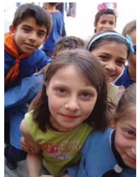
• Children in Sete Sabaa school – Sayeda Zeinab – Syria – November 2009

DRC has been working in close partnership with the Syrian Arab Red Crescent (SARC) and the Ministry of Education. DRC has loyally been supported by the Danish government