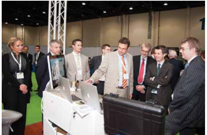
• Kronprinsen besøger den danske stand på WFES i Abu Dhabi

Af: Jan Top Christensen, Ambassadør i Beirut