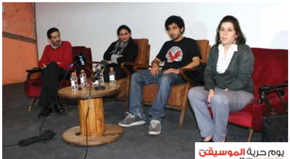
• En af sessionerne hvor vilkårene for alternative musik i Jordan blev diskuteret

I den første session diskuterede man hvilke forhold alternativ musik har i Jordan og hvor-