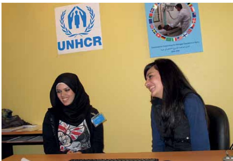
* Students participating in the Higher Education Programme