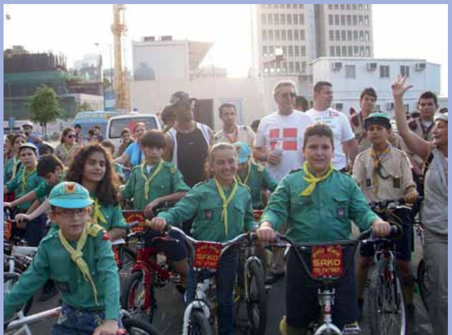
* Scouts from Bourj Hammoud on the bikes at the meeting point by the seaside