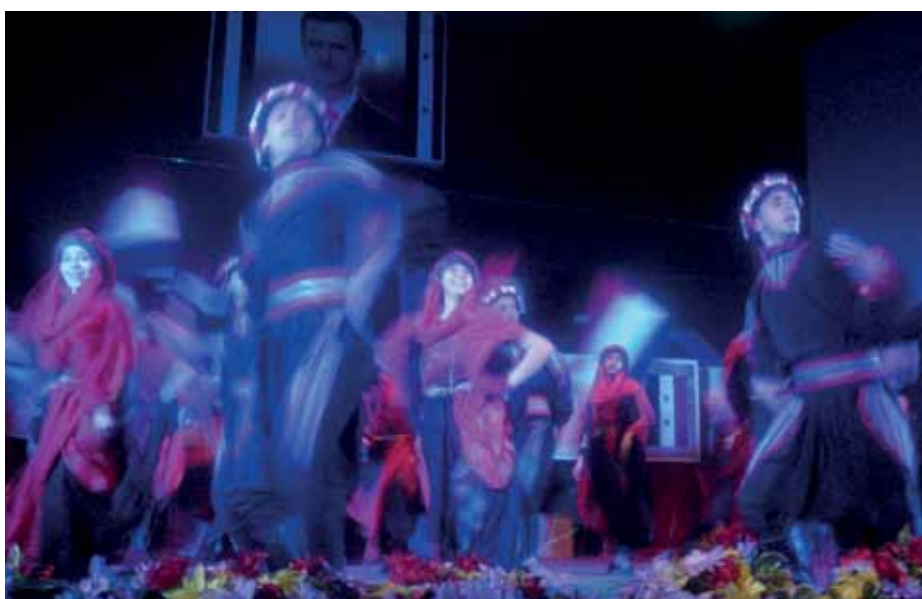
• Skolebørn opfører traditionel palæstinensisk dans