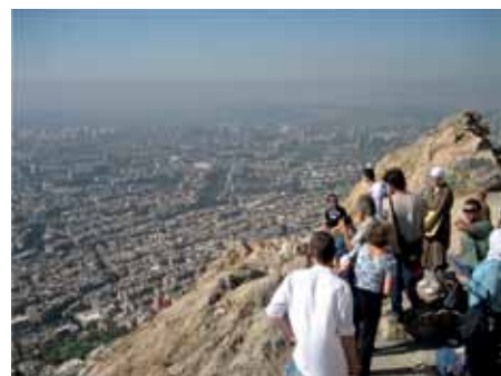
* Summer School

mellem at introducere nye rumligheder (fordi vi tror på "non-formal learning" og at vidensdeling samt innovation sker oftest på tværs af discipliner udenfor klasseværelset) men hvor brugeren samtidig føler sig tilpas.