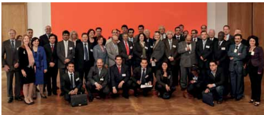
• Deltagere i forårets konference om arabisk-europæisk menneskerettighedsdialog

Arabisk-Europæisk menneskerettighedsdialog, som blev startet af Danmark og Jordan i 2006 afholdt i maj konference i Berlin for nationale menneskerettighedsinstitutioner med fokus på tortur og retssikkerhed. Der var deltagelse fra institutionerne i Mauritien, Algeriet, Tunesien, Marokko, Ægypten, Jordan, Qatar, Tyskland, Grækenland, Norge, Sverige og Danmark. Mere information på www.aehrd.info og www.menneskeret.dk .