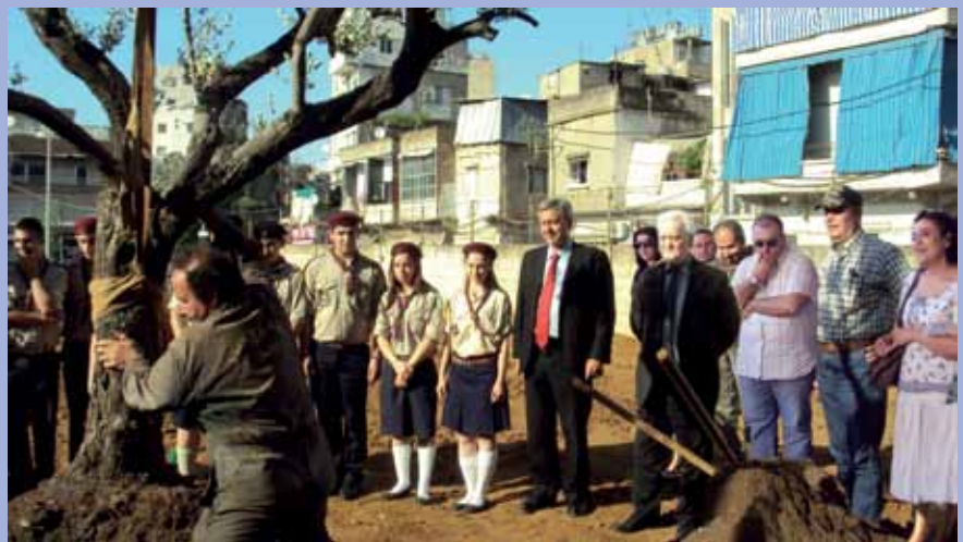
* An olive tree was planted in Bourj Hammoud in the name of Carsten Niebuhr, as a symbol of the historic relations between Denmark and Armenia

Agricultural Rural Village in Syria in order to provide a livelihood for displaced Armenians and the famous College in Aleppo which carries her name, is still continuing to educate generations.