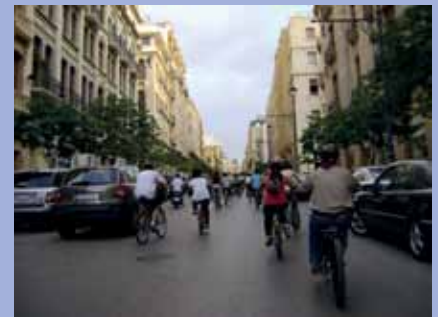
* On their way from Bourj Hammoud to Downtown Beirut