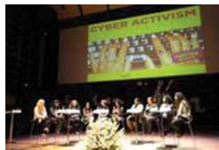
• Paneldebat under forårets konference om cyberaktivisme i Danmark

Det danske programkontor i Jordan er flyttet ind på den svenske ambassade i Amman