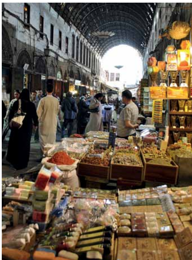
* Dufte af shawarma, sød vandpipe og solopvarmet affald

Da jeg først kom til Syrien i sommeren 2010, sad jeg en klistrende varm aften sidst i august krøllet sammen i en fyldt mikrobus, der konstant dyttende masede sig igennem den tætte trafik ind mod Damaskus' centrum. Min hals og næse sveg pga. bilosen, og øjnene løb i vand. Det var ulideligt varmt selv efter, at solen for længst var gået ned, og sveddråberne trillede af kroppen på mig. Jeg kløede overalt af myggestik og insektbid, og mit ansigt var slået ud i en kæmpe plamage af bumser og røde knopper pga. varmen. Jeg havde rejst hele dagen og var træt. Træt af varmen, træt af at rejse. På trods af billygternes og byens lys var aftenmørket stadig tykt og sort. Der var et mylder af liv, larm og bevægelse, salgstråb fra frugt- og madboderne, den utålmodige trafik, familier på picnic på græsarealerne ved de store omfartsveje, den karakteristiske ”habibi-musik”, der skrattede ud af hver eneste højtaler i biler og restauranter, dufte af shawarma, sød vandpipe og solopvarmet affald. Damaskus' puls slog stærkt omkring mig. Ovenover os