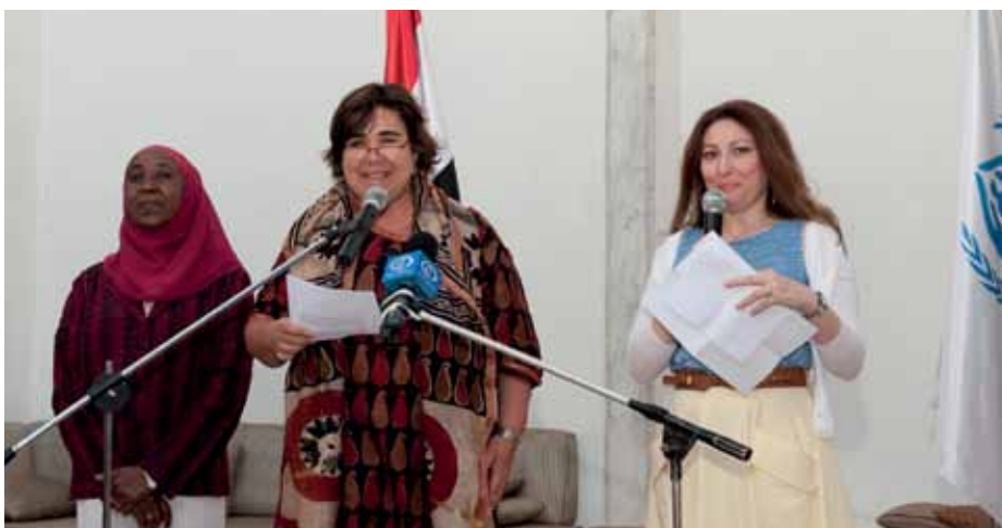
* Some 200 guests attended the Outreach Refugee Volunteers event, organized at the Danish Institute in Damascus, as part of the celebrations of World Refugee Day 2011.