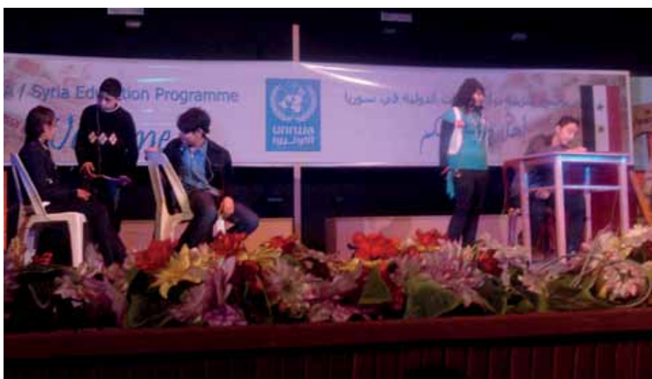
• Skolebørn opfører små scener der viser de dilemmaer de har gennemgået i deres life skills-projekt

I starten af april deltog den danske ambassade i Damaskus i en forestilling for at markere afslutningen på et 3 måneder langt læringsforløb i life skills på en UNRWA-skole i den palæstinensiske flygtningelejr Yarmouk. I alt deltog 40 elever og 27 lærere i undervisningen, der har haft til formål at give deltagerne værktøjer til at behandle emner som ligestilling, konfliktløsning og unges deltagelse i samfundet. Undervisningen har været kendetegnet ved aktiv deltagelse af børnene og været præget af små skuespil som udgangspunkt for at få deltagerne til at diskutere forskellige vanskelige dagligdags problemstillinger. Formålet med undervisningen var at lære eleverne refleksion, forståelse og betydningen af social interaktion. Projektet er finansieret af Udenrigsministeriet og er et sideprojekt til renoveringen af Malkiyeh School, den største UNRWA-skole i Syrien, der blev afsluttet i 2010. UNRWA har 28 skoler i Yarmouk med i alt 25.000 elever. UNRWA koordinerer også andre projekter for at forbedre de sociale levevilkår for de palæstinensiske flygtninge; disse inkluderer udover uddannelse også sundhedsfremme, mikrolån m.m.. Danmark er en af de største bidragsydere til UNRWA's arbejde med palæstinensiske flygtninge i den mellemøstlige region.