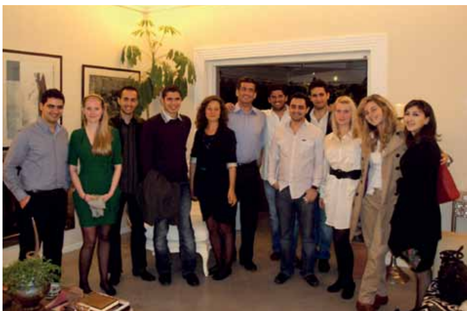
• Radikal Ungdom and Tajaddod Youth

After several meetings in June the answer to that question is a firm "yes!" By sharing the same ideals of freedom, democracy, tolerance and the fight against social injustice, the two youth parties can engage