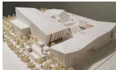
* Aleppo House of Culture

Henning Larsen Architects er et internationalt arkitektfirma med 158 ansatte af 15 forskellige nationaliteter. I Levanten arbejder Henning Larsen Architects primært med kultur og uddannelses projekter. Se mere på: www.henninglarsen.com